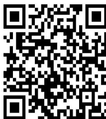
2.安装新能源汽车充电桩