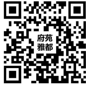
物业权力事项清单