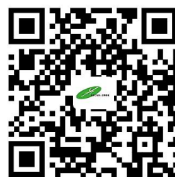
学校服务事项清单