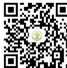
学校服务事项清单