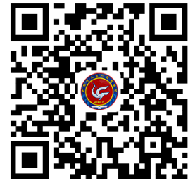
学校服务事项清单