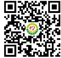
学校服务事项清单