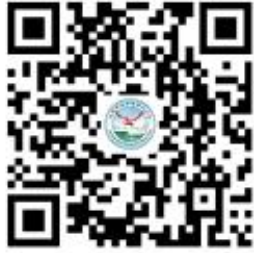
家庭经济困难学生认定