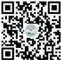
在校生临时困难补助