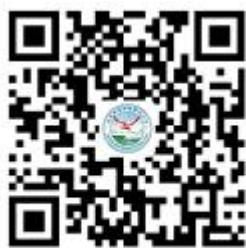
学籍信息变更申请