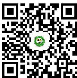
家庭经济困难学生认定