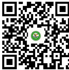
在校生相关证明服务