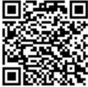
沈阳市辽中区茨榆坨第二小学