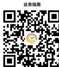
9.在校生临时困难补助

9.4 温馨提示： 符合条件的同学先到学校申请，学校统一报到学生资助管理中心。如有问题可拨打 27750023 咨询。