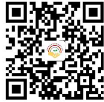
学校服务事项清单