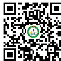
学校服务事项清单