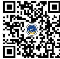
学校服务事项清单