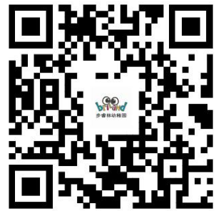
幼儿园服务事项清单