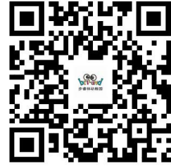
容缺办理事项清单