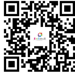
违规禁办事项清单