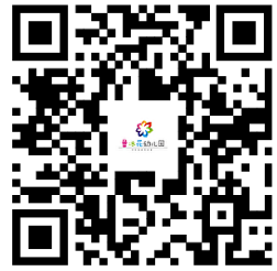
幼儿园服务事项清单