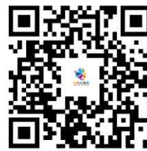
容缺办理事项清单