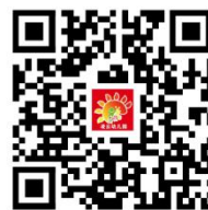
幼儿园服务项目清单