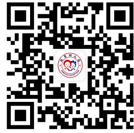
幼儿园服务事项清单