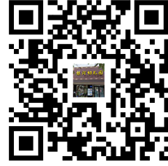
容缺办理事项清单