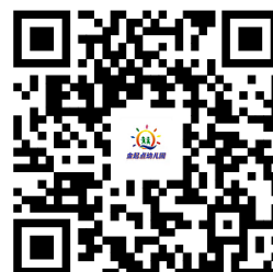
幼儿园服务事项清单