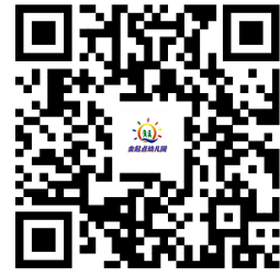
违规禁办事项清单