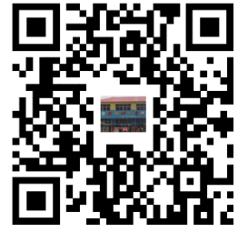
违规禁办事项清单