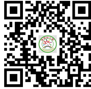
违规禁办事项清单