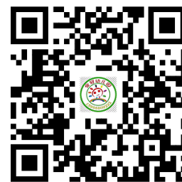
幼儿园服务事项清单