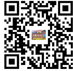
容缺办理事项清单