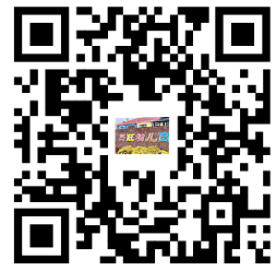
幼儿园服务事项清单