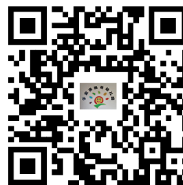
违规禁办事项清单