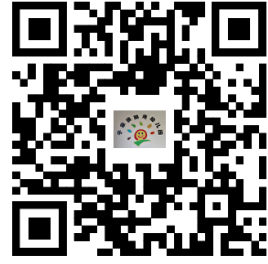
容缺办理事项清单