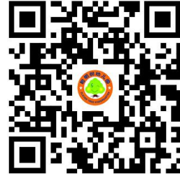
幼儿园服务事项清单