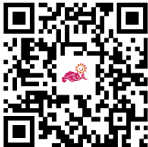
幼儿园服务事项清单