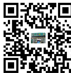
容缺办理事项清单