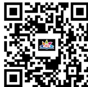
幼儿园服务事项清单