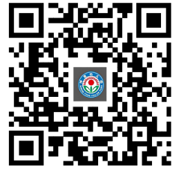
违规禁办事项清单