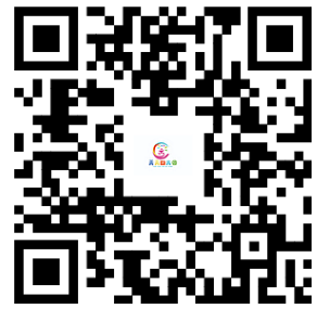
幼儿园服务事项清单