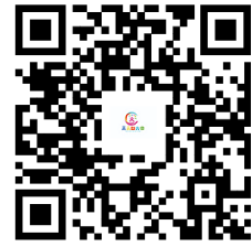
容缺办理事项清单