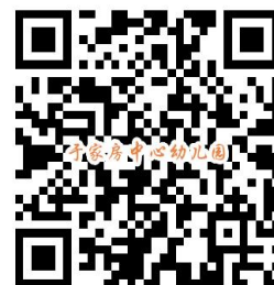
幼儿园服务事项清单