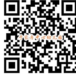
违规禁办事项清单