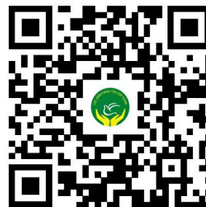
幼儿园服务事项清单