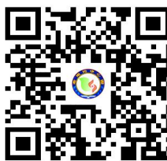
幼儿园服务事项清单