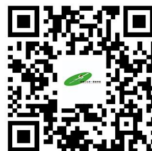
幼儿园服务事项清单