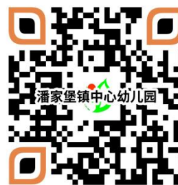
幼儿园服务事项清单