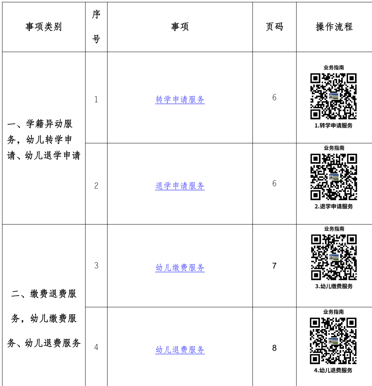
幼儿园服务事项清单