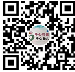
违规禁办事项清单