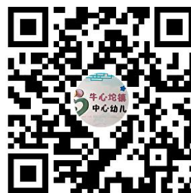
幼儿园服务事项清单