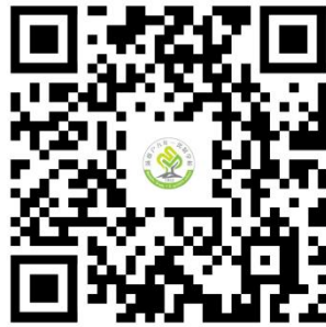
违规禁办事项清单