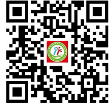
幼儿园服务事项清单