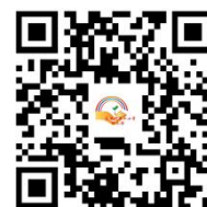
违规禁办事项清单