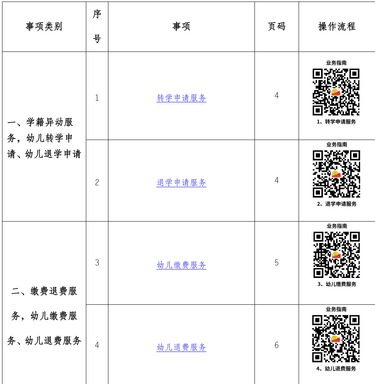
幼儿园服务事项清单