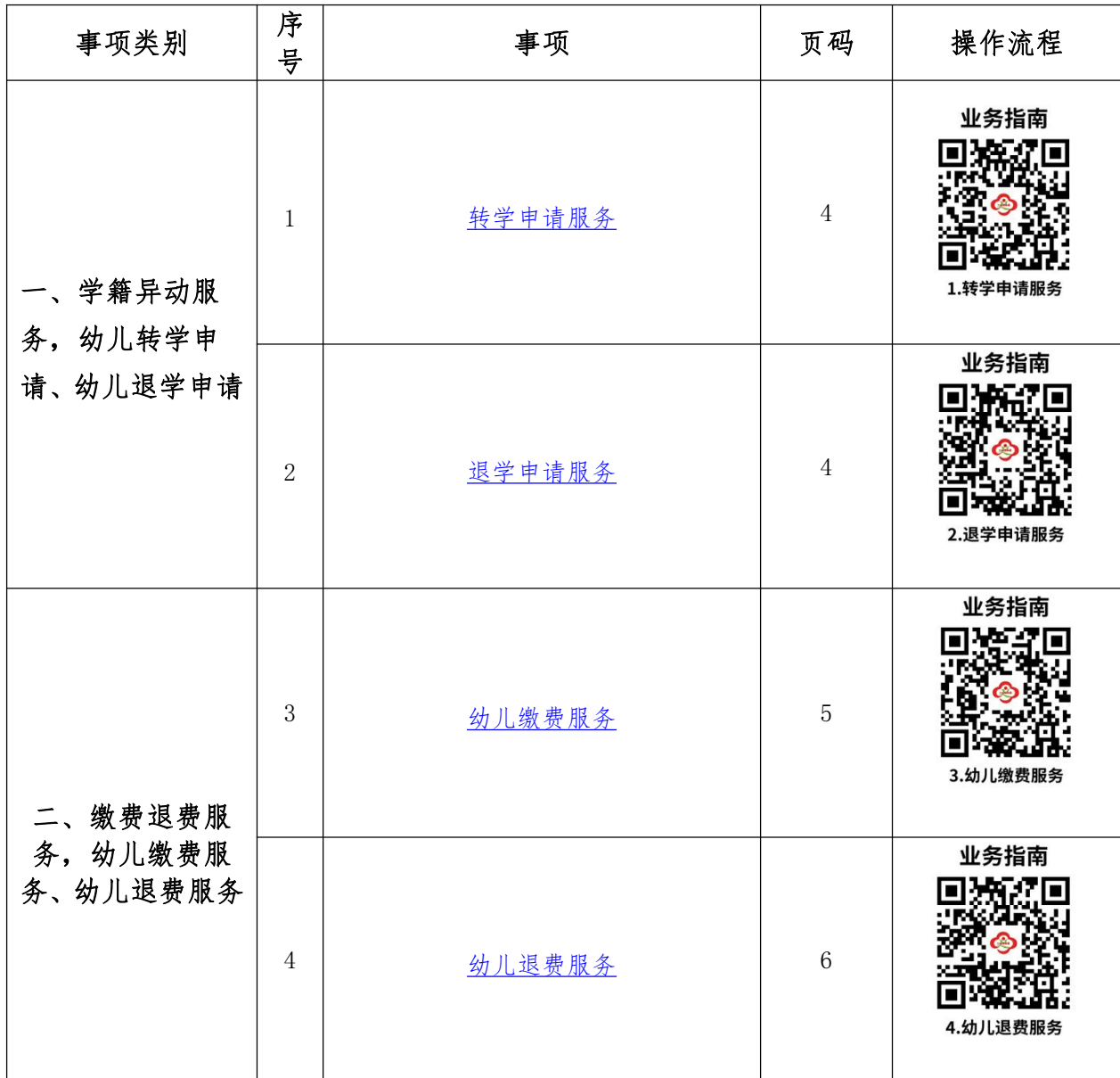
幼儿园服务事项清单