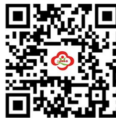
容缺办理事项清单