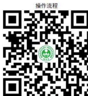
5. 排污许可-变更及补领

全国排污许可证管理信息平台： http://permit.mee.gov.cn/