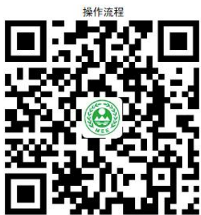
21. 组织开展拆船单位关闭或者搬迁检查验收

② 网上办 ：沈阳政务服务网： http://zwfw.shenyang.gov.cn/