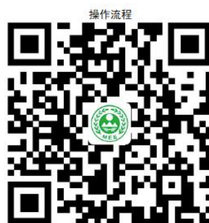
24. 对产生危险废物单位的危险废物管理计划的备案

② 网上办 :沈阳政务服务网: http://zwfw.shenyang.gov.cn/