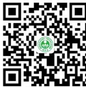
“首违不罚”事项清单

对当事人两年内首次发生清单中所列事项且危害后果轻微，在生态环境执法部门发现前主动改正或者在责令改正后立即改正的，不予行政处罚。