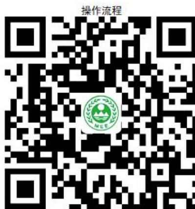
29. 对企业事业单位突发环境事件 应急预案的备案及变更

②网上办:沈阳政务服务网: http://zwfw.shenyang.gov.cn/