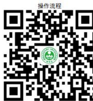
11. 放射性核素排放许可

② 网上办 :沈阳政务服务网: http://zfwf.shenyang.gov.cn/