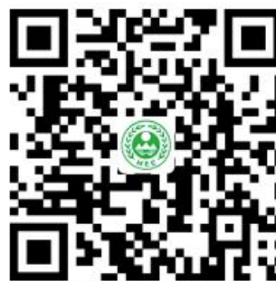
生态环境权力事项清单