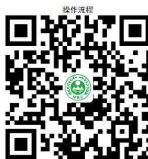
23. 环境影响后评价备案

② 网上办 ：沈阳政务服务网： http://zwfw.shenyang.gov.cn/