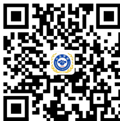
危险化学品经营许可证颁发申请