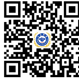
应急局权力事项清单