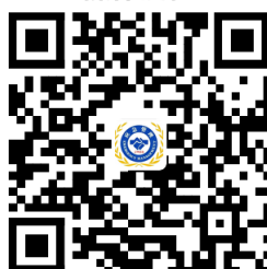
烟花爆竹经营（零售）许可