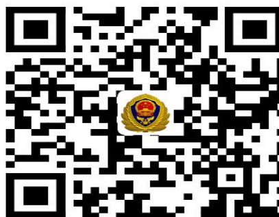
消防权力事项清单