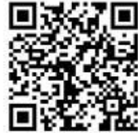
容缺受理事项清单